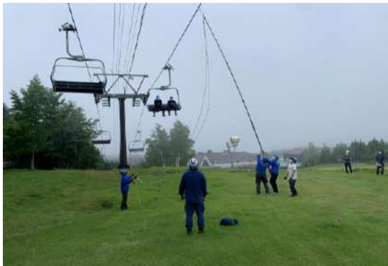
【夏季勤務前救助訓練】