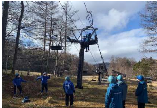
【冬季勤務前救助訓練】